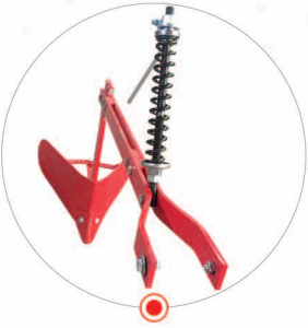
BOĞAZ DOLDURMA KÜREĞİ MISIR İÇİN