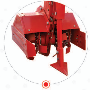
MISIR ÜNİTESİ TAM