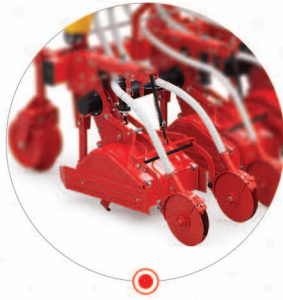
GÜBRE GÖMÜCÜ ÇİFT DİSK TERTİBATI DİSK BAŞI